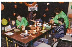
ボランティアフェスティバル