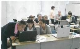
講師の皆さんは親身にパソコンの使い方を教えてくれます。

明してもらおうようにしていることです。人に操作を教えることでパソコンの使い方が身についていきます。パソコンを使いこなせると、段々と楽しくなってくるので、皆さんにもその楽しさを体験してもらいたいと思います。