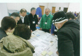
避難所の設置模擬訓練。非常時の対応について参加者と共に考えます。

運営すればいいのか、そんな不安を抱えました。2年前に防災士となり、現在は、地区へ出向き、防災士会メンバーと防災についての啓発活動を行う他、防災に関する研修会に参加しています。今後は、避難所の運営マニュアルや自主防災組織の確立に向けて、また、福祉避難所についても体制を整備していきたいと考えています。皆さんと共に考えていきたいと思っています。