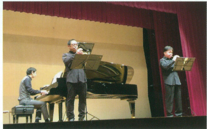
トランペットとピアノによる アンサンブルDITテンジン