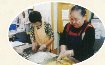
有磯苑新館にある喫茶コーナー