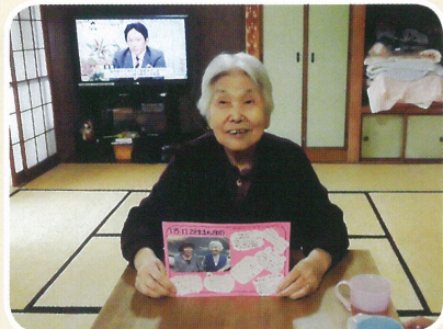
皆さんの笑顔がとても印象的でした。

A: カエルの子では午後に誕生会やお出かけ、カラオケ等の余暇活動を行っています。その時に一緒に踊ったり・歌ったりして、ともに盛り上げ楽しんでくれるボランティアさんがいてくれると嬉しいです。もちろん話し相手をしてくれる方も歓迎です。