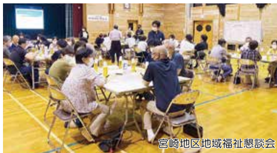
宮崎地区地域福祉懇談会

7月から宮崎地区を皮切りに、「地域福祉懇談会 (以下、懇談会)」を開催しています。この懇談会では、日々の暮らしのなかで、困っていることや不安に思うこと、また地域の良い所、やってきて良かったこと等の意見を出し合い、住民の皆さんが自分たちが地域でできること (互助) や、他の機関と協力して行うこと等を話し合っています。話し合いを通じて、日頃の見守りや支え合い、災害対応、子育て支援等を「我が事 (わがごと)」として考えるきっかけにもなっています。また、懇談会での皆さんの貴重なご意見は、第2期朝日町地域福祉計画ならびに第5次朝日町地域福祉活動計画策定のための重要な資料として活用させていただく予定です。