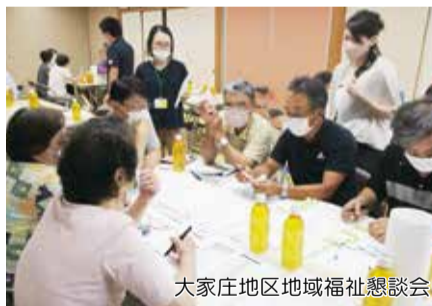
大家庄地区地域福祉懇談会