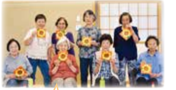
おはようサロンで、ひまわりを作りました！

その後、結婚、出産を経て、子育ての合間に、町で行われたボランティア養成講座に参加し、障がい者施設で作業補助のボランティアも行いました。