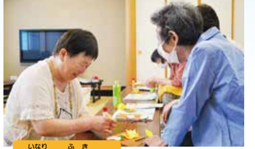
いなり 稲荷さん ふき 富貴さん